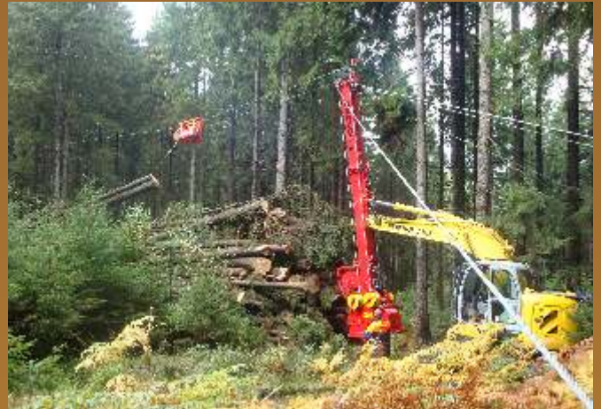
Bild oben: Maschine im 3-Seil Einsatz auf der Ebene Bild unten: Yarder-Ausführung mit Rückholseilwinde

Optional ist ein Schnellwechseladapter lieferbar. So bleibt Ihr Bagger als universelles Trägergerät nutzbar.